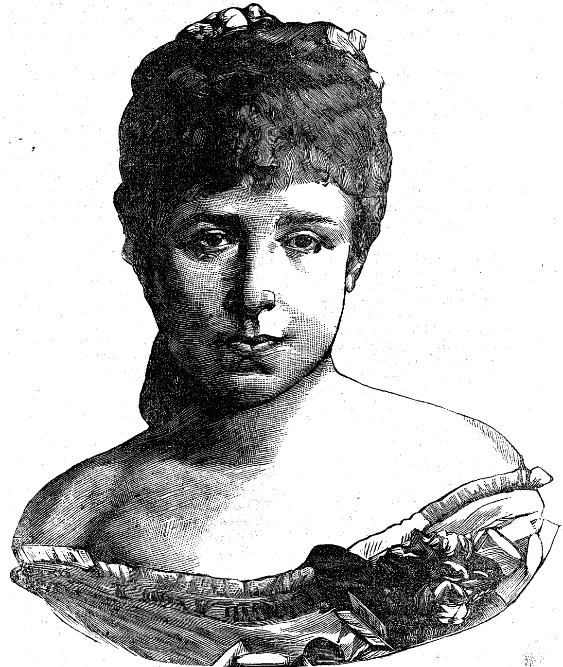
Ἡ ἀρχιδούκισσα ΜΑΡΙΑ ΧΡΙΣΤΙΝΑ βασίλισσα τῆς Ἰσπανίας.

μένου Κλήρου καὶ ἀνευ τῆς ἐξ ἀπαλῶν ὀνύχων χριστιανικῆς καὶ ἠθικῆς μορφώσεως τῶν Ἑλληνοπαίδων εἶναι ἀδύνατον ἡ κοινωρία ἡμῶν ἐξαχρειουμένη ἐπὶ τέλους νὰ μὴ καταρρεύσῃ, δὲν δύναμαι νὰ μὴ συγχαρῶ ἀπὸ καρδίας καὶ ὑμᾶς, Κύριε Πρόεδρε, καὶ ἅπαντα τὰ ἀξιότιμα μέλη τοῦ Θεολογικοῦ Συλλόγου διὰ τὴν εὐγενῆ καὶ κοινωφελέστατον